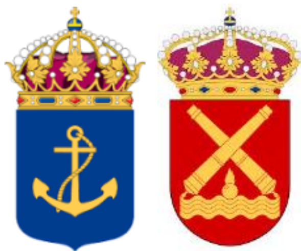
Flottans Emblem/Kustartilleriets Emblem